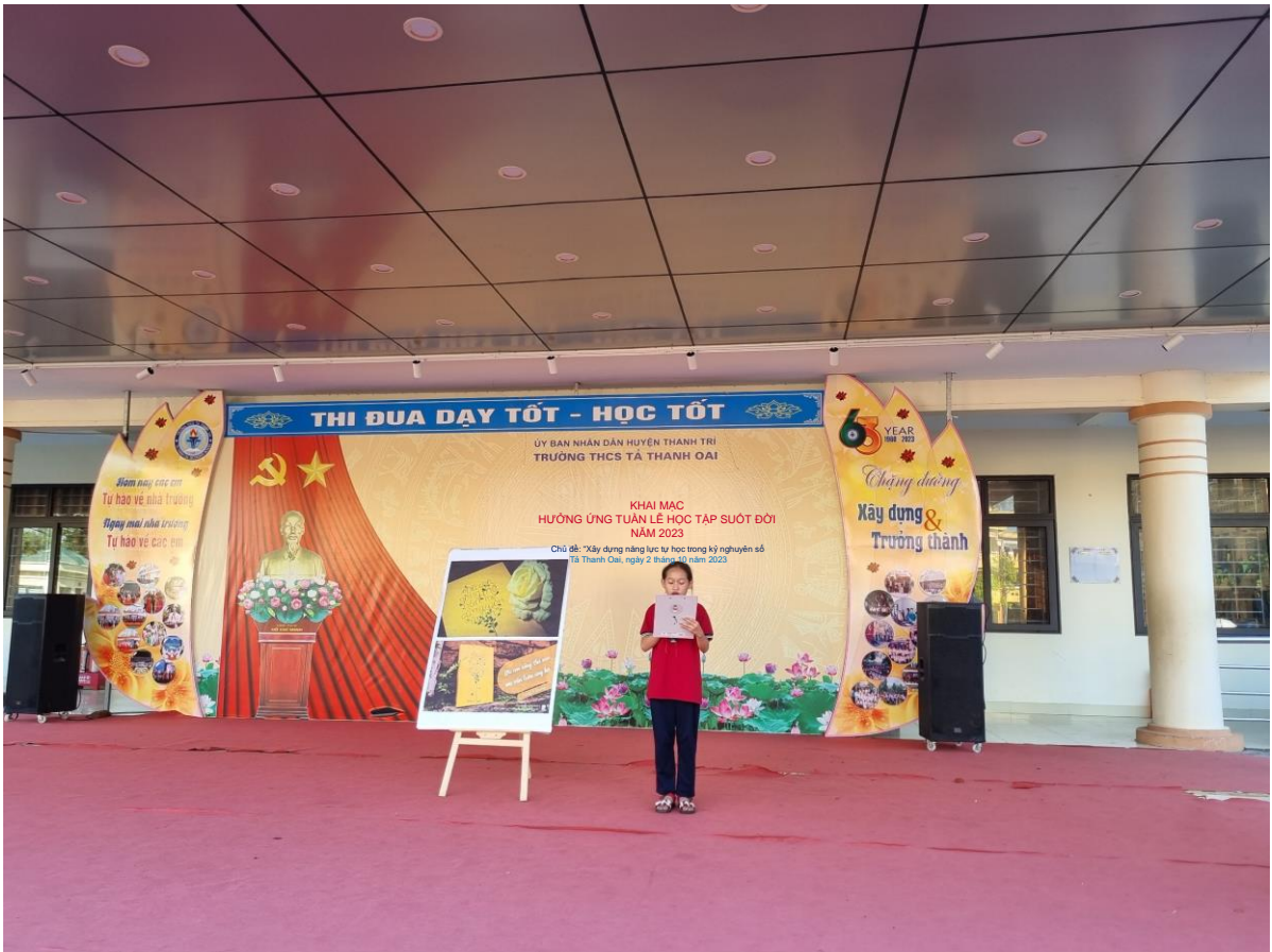
Hoạt động “giới thiệu sách”, “xây dựng tủ sách nhỏ lớp em”